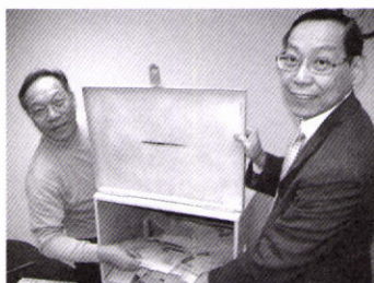
監票人開啟選票箱

社會工作者註冊局第五屆成員選舉已於二零零九年十二月順利舉行，是次選舉中有前線社工、督導、社工學者等共十五位參選人，而提名方法及投票方式與上一屆的基本相同，點票日的早上也設有即場投票，方便未能趕及郵寄選票的同工親臨註冊局辦事處投票。