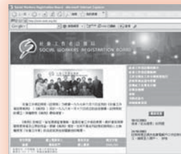
重整後的註冊局網頁

註冊局自一九九八年成立後不久，已設立互聯網網頁，讓同工及公眾瞭解有關註冊局的概況及增進彼此的溝通。隨著近年註冊局工作的發展，舊有網頁已不敷應用，因此，註冊局從去年底便開始著手重整網頁，新版網頁已於本年二月起開始啟用。重整後的網頁除可為同工及公眾帶來耳目一新的感覺外，相信亦可以更有組織地及以較互動的形式讓同工及公眾搜尋所需的資訊，令網頁更有效地成為註冊局與外界之間的溝通橋樑。